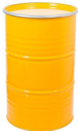
Bidón alimentario 300 Kg