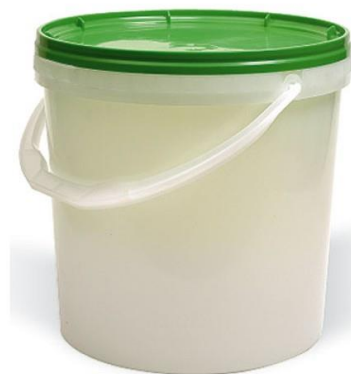
Cubo de plástico 20 Kg