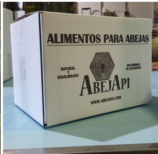
Caja de 12 Kg