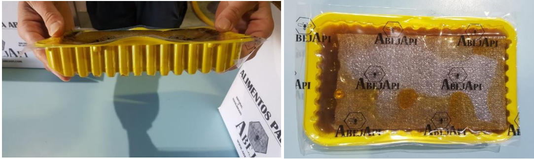
Tarrina termosellable PET/PE con flotador. Medidas: 165mm ancho x 240 mm largo x 35 mm alto