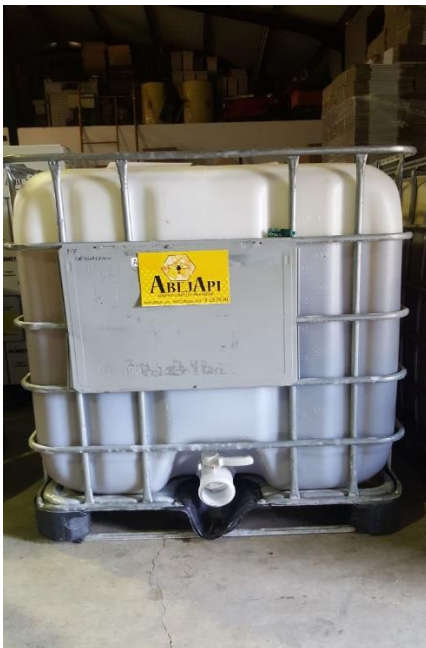
Deopósito IBC 1200 Kg