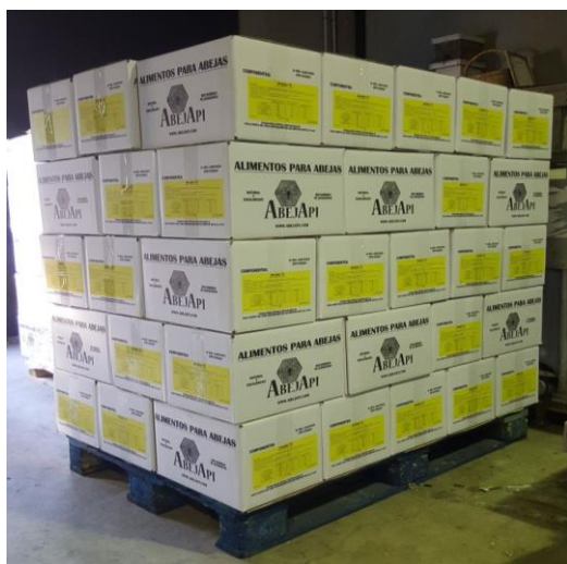
Palet de 720 Kg (60 cajas de 12 Kg)