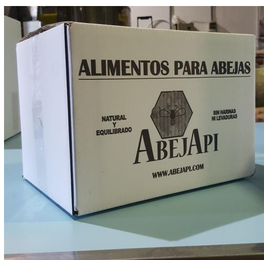
Caja de 12 Kg