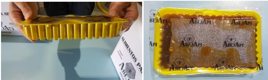
Tarrina termosellable PET/PE con flotador. Medidas: 165mm ancho x 240 mm largo x 35 mm alto